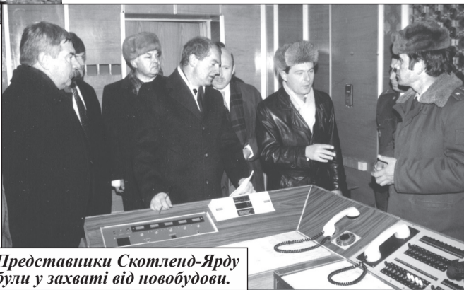
Представники Скотленд-Ярду були у захваті від новобудови.

А згодом постало питання естетики, обладнання, освітлення і навіть кольору стін і гардин. Я із задоволенням і ностальгією згадую той період будівництва. На мою долю випало виконання завдань щодо пошуку необхідних матеріалів та обладнання. Звечора обговорюємо завдання, а наступного дня я вже у Запоріжжі, де комплектуємо тренажери для спорткомплексу, а в спортивному залі в цей час монтують підлогу. У Міністерстві внутрішніх справ України підписував документи на одержання килима для відпрацювання прийомів рукопашного бою.