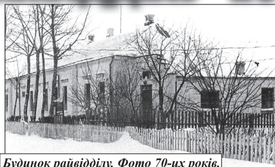
Будинок райвідділу. Фото 70-их років.

віть Москві побудувати такий комплекс господарським шляхом було б неможливо. Велика заслуга в тому, що мрія стала реальністю, тодішнього колективу райвідділу. Значну частку допоміжних робіт виконували співробітники міліції на суботниках, в особистий час. І ви знаєте, я жодного зі своїх колишніх підлеглих не бачив байдужим. Усі допомагали, чим могли, вносили свою долю в будівництво і при цьому сумлінно виконували службові обов'язки. Велику допомогу ми отримували від керівників району і господарств, а І.Ропавка був постійним порадником і спонсором будівництва. Особливо я вдячний за підтримку і неоціненну допомогу Анатолію Івановичу Тимошенку – на той час першому заступнику голови Полтавського облвиконкому, Олексію Сергійовичу М'якоті – тодішньому голові облвиконкому, а потім першому секретареві обкому КПУ, які, на жаль, уже пішли із життя, а також колишньому народному депутату СРСР Григорію Івановичу Шарому, колишньому прем'єр-міністрові України Вітольду Павловичу Фокіну, міністрам внутрішніх справ України Івану Дмитровичу Гладушу й Андрію Володимировичу Василюшину, тодішньому голові Полтавського облвиконкому Івану Олександровичу Голею, завідувачу оргвідділом обкому КПУ Мико-